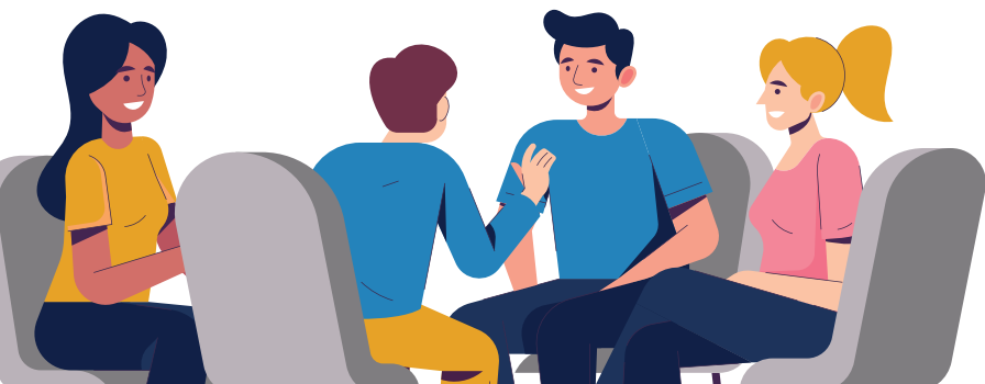
Tavola rotonda con i relatori.